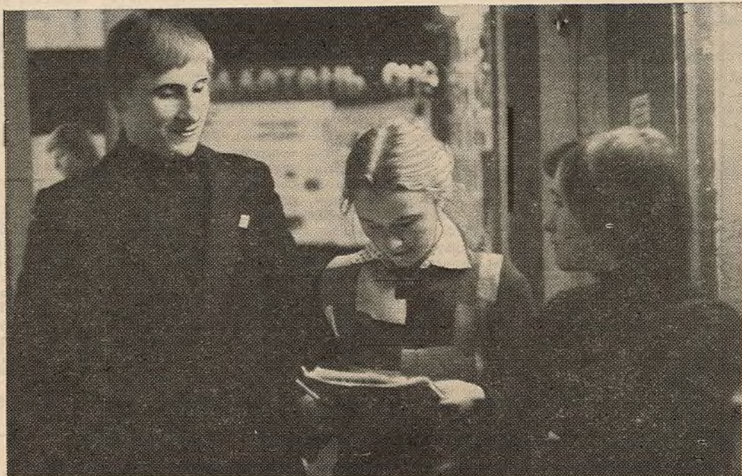
З творчым натхненнем пачалі заняткі студэнты факультэта журналістыкі ў другім семестры.